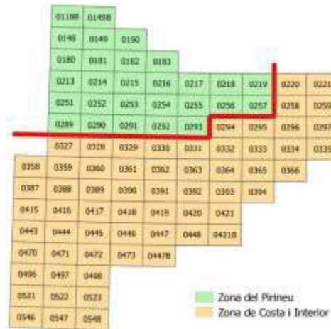
Figura 5.1. Distribució espacial, orientativa, de l'ortofoto 25 cm segons el mètode de generació

Aquest mapa pot variar segons els anys de vol. A la pàgina web de l'ICGC i a les metadades del producte es pot consultar la informació relativa a la versió vigent.